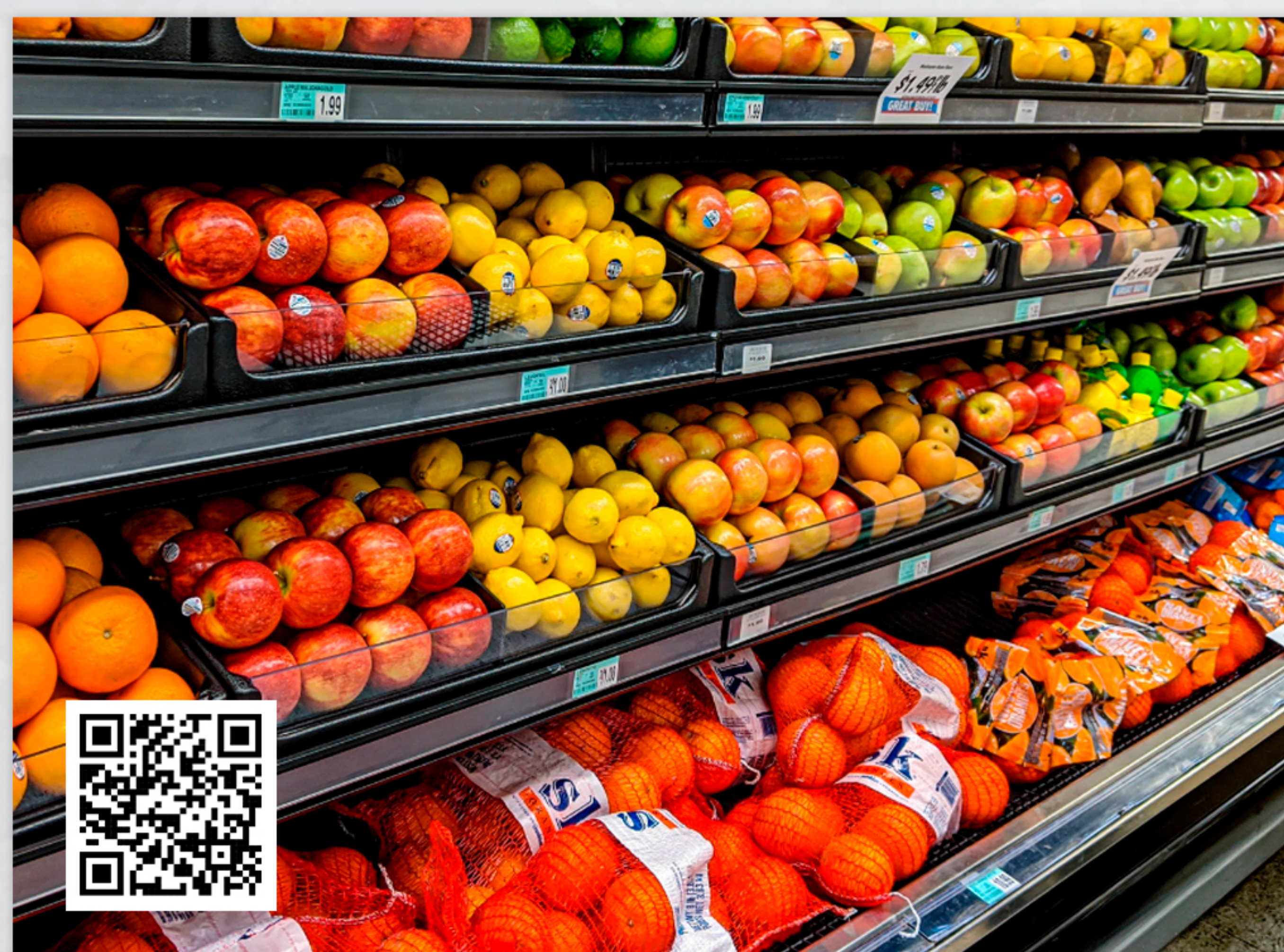
Grupo de alimentos recuou 0,53% na prévia da inflação de agosto. Fonte: G1

O IPCA-15, considerado uma prévia da inflação oficial, apresentou retração de 0,14% no mês de agosto de acordo com o IBGE. É a primeira deflação em mais de dois anos e a mais acentuada desde setembro de 2022.