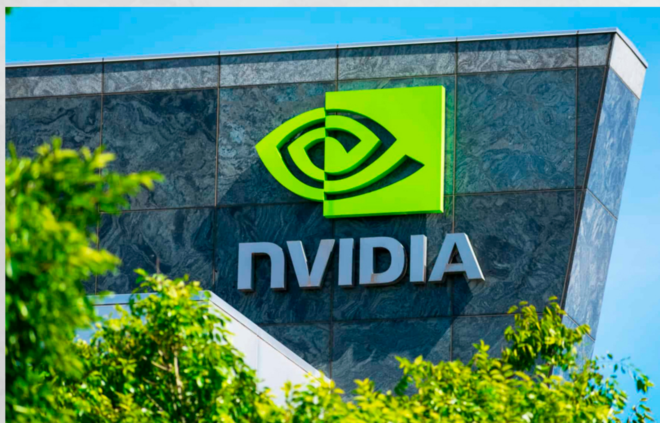
Resultado da Nvidia superou previsões de analistas.

Apesar dos números positivos, as ações da empresa caíram mais de 3% nas horas seguintes à divulgação. O resultado do Data Center foi afetado por uma queda de US$ 4 bilhões nas vendas do chip H20, especialmente devido à ausência de negociações com clientes da China. Ainda assim, a companhia compensou parte dessa perda com a liberação de estoques previamente reservados a clientes fora do país.