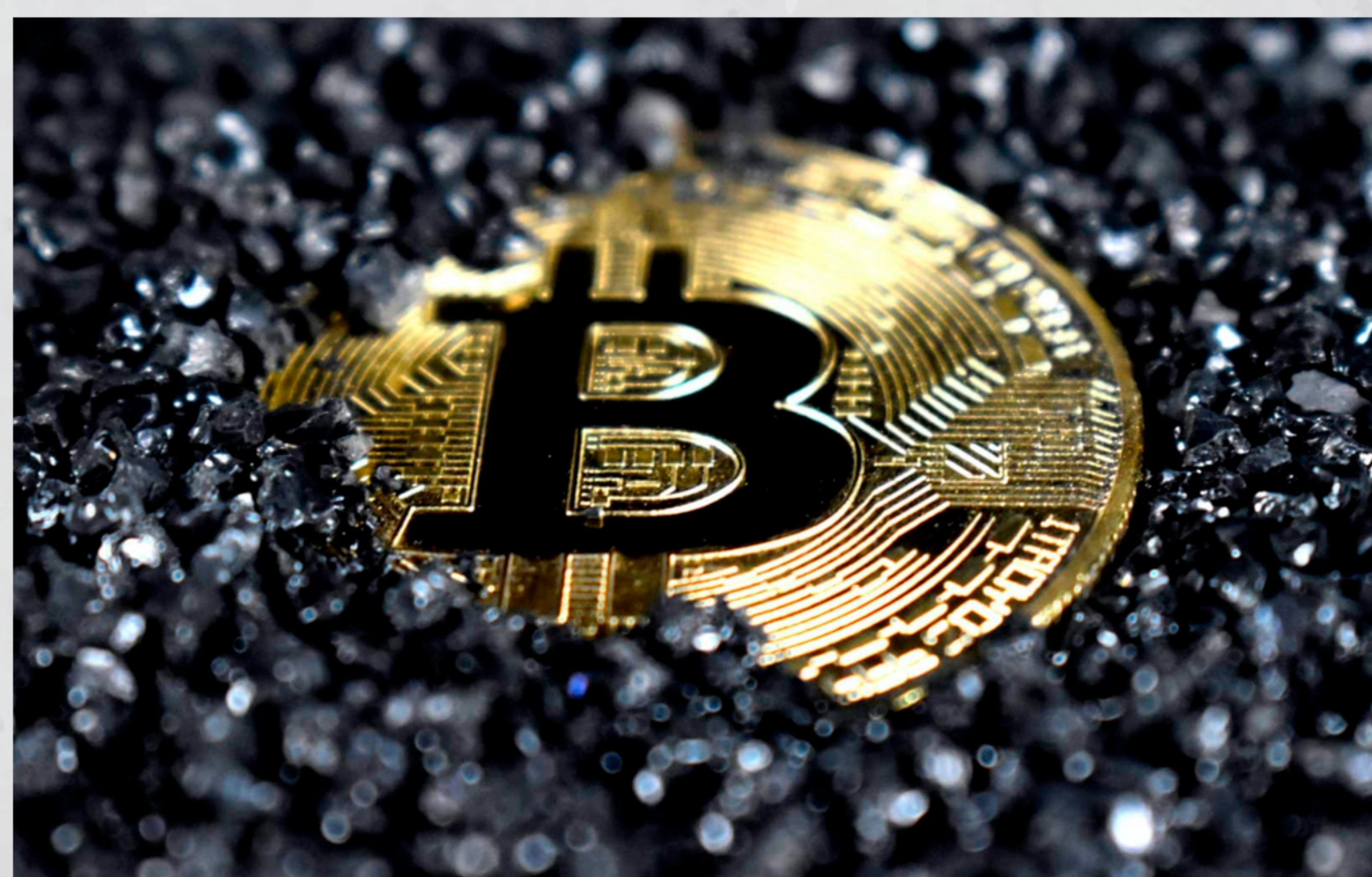
Um zettahash por segundo equivale a um sextilhão de tentativas de mineração por segundo.

O Bitcoin superou pela primeira vez o patamar de 1 zettahash por segundo, equivalente a um sextilhão de tentativas de mineração a cada segundo. O recorde reforça a segurança da rede, já que quanto maior o hashrate, mais difícil e caro se torna realizar ataques.