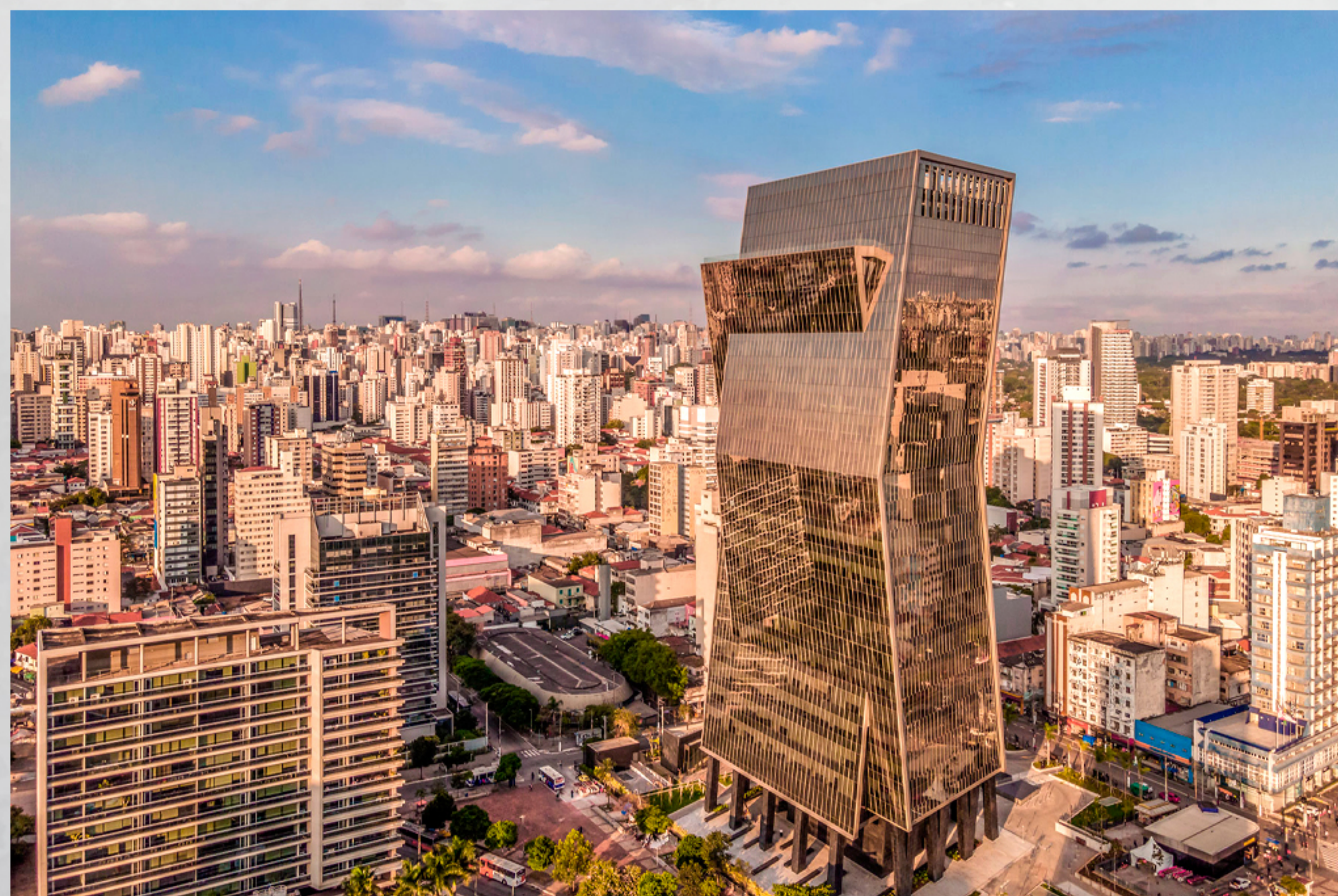
Operação Carbono Oculto teve empresas da Faria Lima como alvo.

Segundo os auditores, os fundos eram estruturados de forma fechada, geralmente com um único cotista, o que permitia camadas de disfarce nas operações financeiras. O capital sustentou a compra de um terminal portuário, quatro usinas de álcool, cerca de 1.600 caminhões de transporte de combustíveis e mais de 100 imóveis. As investigações revelam ainda que uma fintech, que funcionava como espécie de banco clandestino, movimentou sozinha R$ 46 bilhões em valores sem rastreabilidade. Parte desse dinheiro abastecia importadoras responsáveis pela compra de combustíveis no exterior, como nafta e diesel, revendidos em uma rede de mais de mil postos distribuídos em dez estados. Entre 2020 e 2024, estima-se que o grupo tenha importado mais de R$ 10 bilhões em combustíveis.