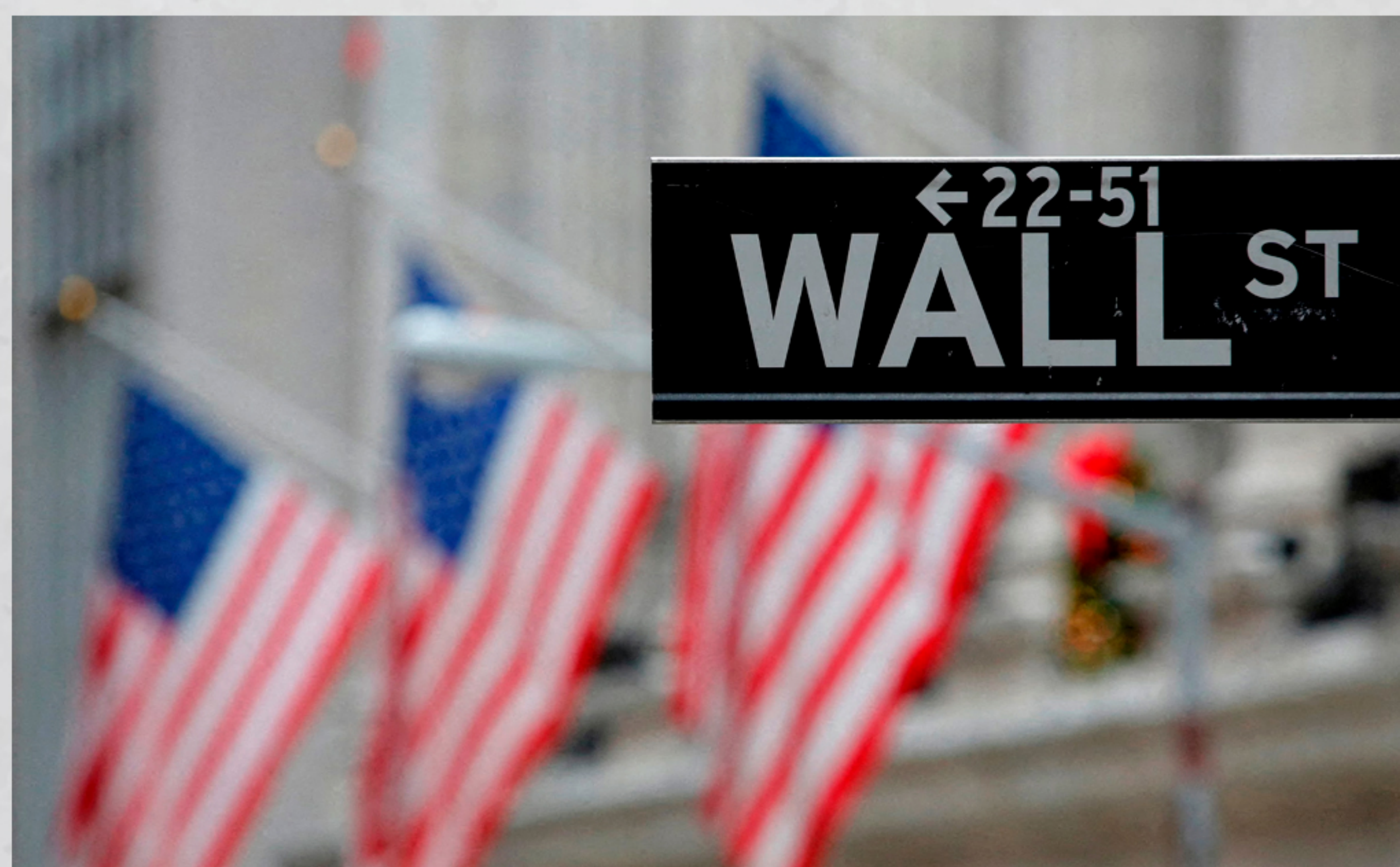
American Bitcoin, apoiada pela família Trump, pode estreitar na Nasdaq no próximo mês.

A American Bitcoin, controlada em 80% pela Hut 8 e com 20% de participação de Donald Trump Jr. e Eric Trump, planeja estreitar na Nasdaq em setembro deste ano. A empresa conclui uma fusão com a Gryphon e já captou US$ 220 milhões para ampliar operações em mineração de criptomoedas.